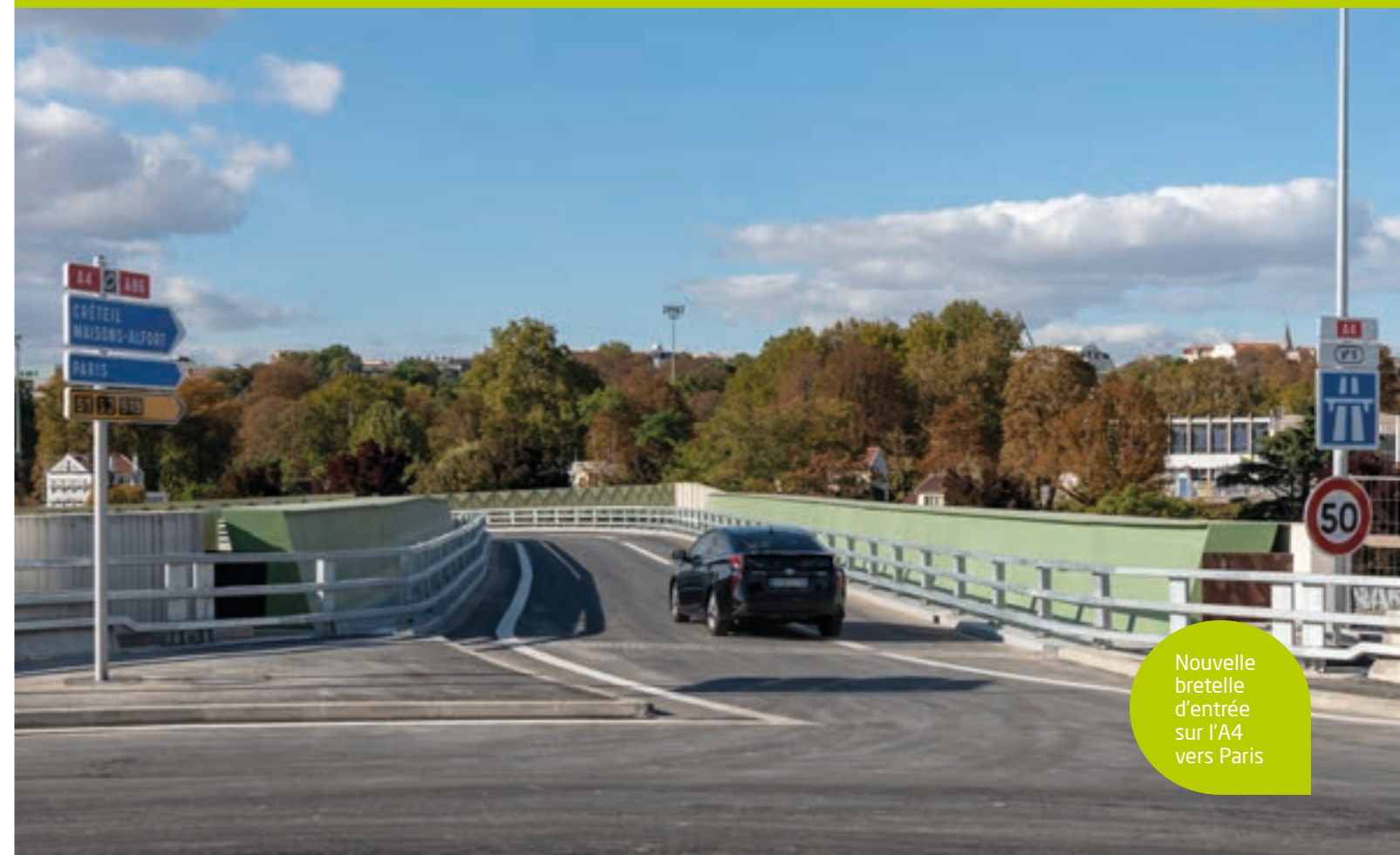
Nouvelle bretelle d'entrée sur l'A4 vers Paris

P A R I S M A G - crédits photos : DIRIF - Ne pas jeter sur la voie publique