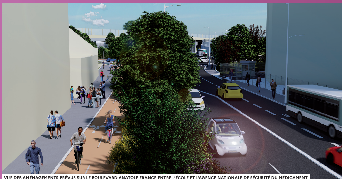
VUE DES AMÉNAGEMENTS PRÉVUS SUR LE BOULEVARD ANATOLE FRANCE ENTRE L'ÉCOLE ET L'AGENCE NATIONALE DE SÉCURITÉ DU MÉDICAMENT