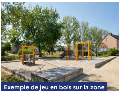
Exemple de jeu en bois sur la zone