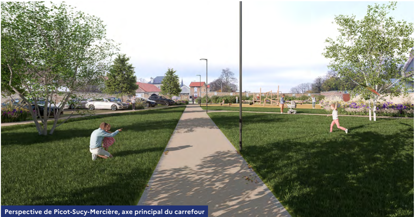
Perspective de Picot-Sucy-Mercière, axe principal du carrefour