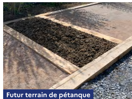
Futur terrain de pétanque