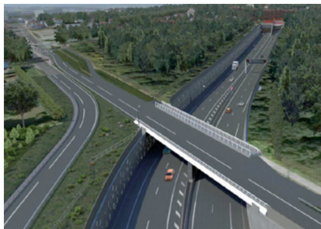
⬆ Simulation de la tranchée ouverte dans la forêt de Grosbois