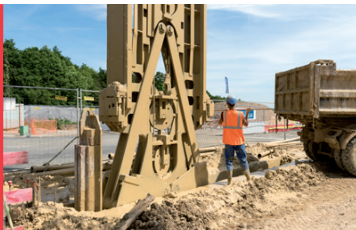
⬆ Réalisation des parois moulées du diffuseur