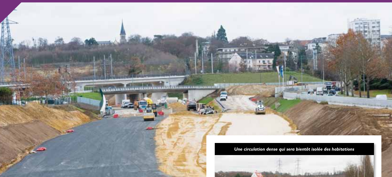
Une circulation dense qui sera bientôt isolée des habitations