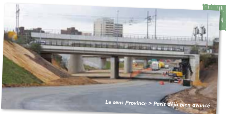
Le sens Province > Paris déjà bien avancé

Pour l'instant nous préférons garder cet espace fermé, car il sera nécessaire seulement quand il supportera le trafic vers Paris. Nous ouvrirons donc cette voie conjointement à l'ouverture du sens Province > Paris et à la modification du carrefour.