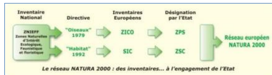
Figure 1 : La constitution du réseau européen Natura 2000

La mise en place d'un site Natura 2000 se décompose en trois volets :